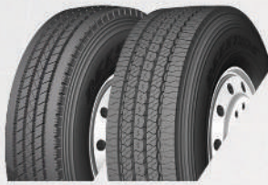
SV402 Plus SV403